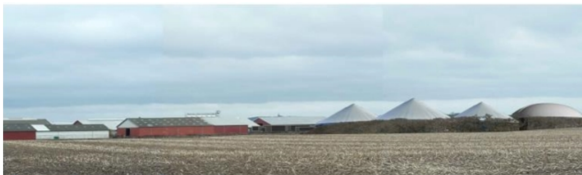
Visualisering set fra syd fra nærmeste nabo på Kragekærvej. Det nye levende hegn er her vist med en højde på 7-8 meter. Tankene er vist med en højde på 14 meter.