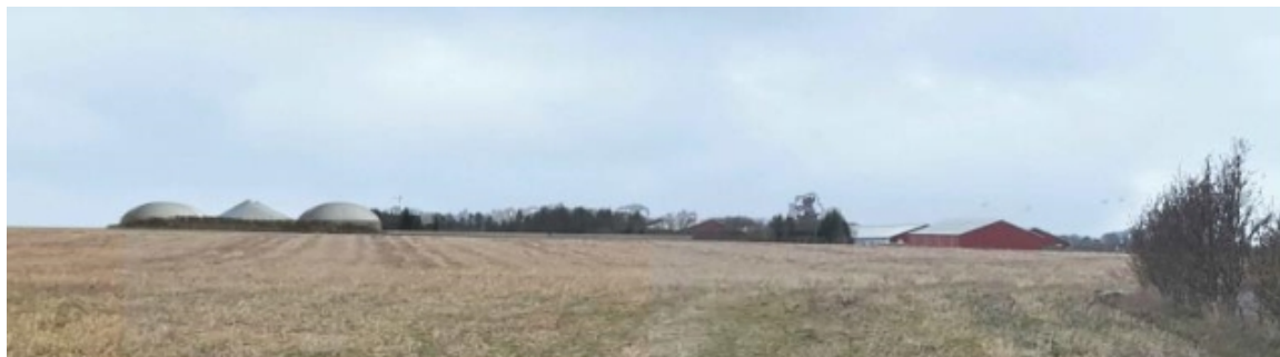
Visualisering set fra øst fra landsbyen Gesinge. Det eksisterende levende hegn er her vist som nedskåret.

Der er udarbejdet flere visualiseringer, der viser hvordan biogasanlægget vil opleves fra nærmeste naboer og fra landsbyen Gesinge. Fra nærmeste naboer og fra Gesinge opleves biogasanlægget stort på grund af sin størrelse og sin tekniske udformning. Anlægget ligger sammen med de eksisterende landbrugsbygninger, så man opfatter biogasanlæg og husdyrbrug som en samlet enhed i det store, åbne landbrugslandskab. Dæmpede farver på siloerne samt hegnbeplantning vil indpasse anlægget i omgivelserne og dermed dæmpe anlæggets visuelle fremtræden.