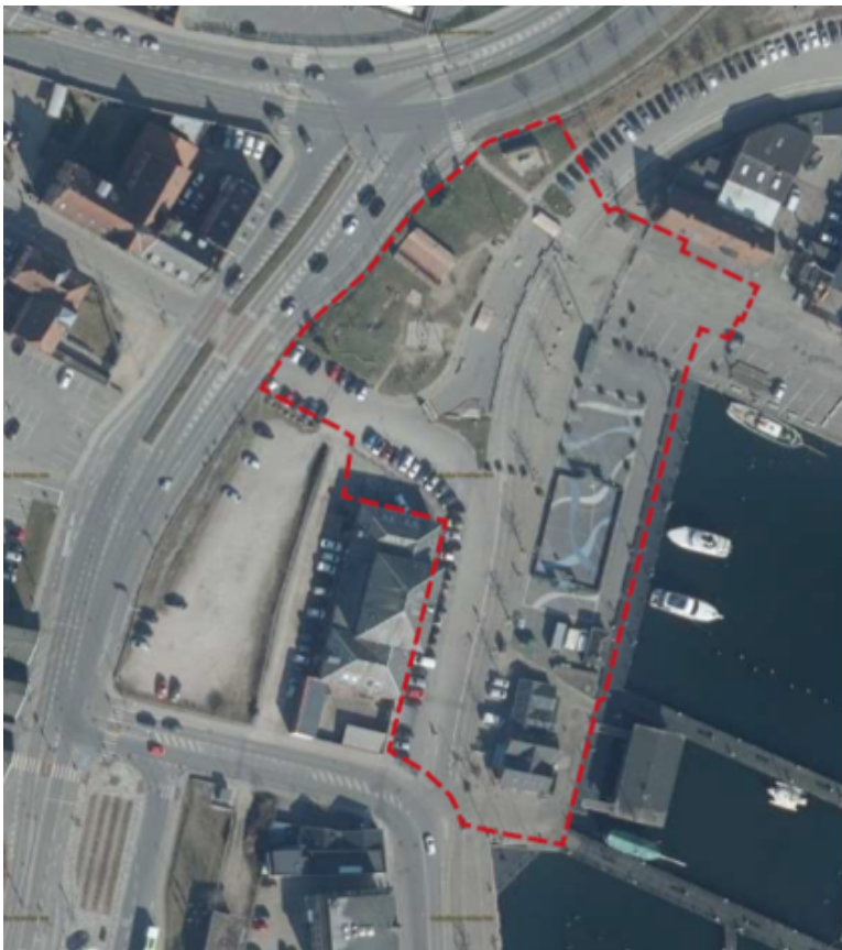
Illustration: Afgrænsning af havnepark

Havneparkprojektet omfatter arealerne øst og nord for Toldboden på Jessens Mole. Mod nord vil Havneparken blive afgrænset af Godsbanearialet og Havnearbejdernes Hus.