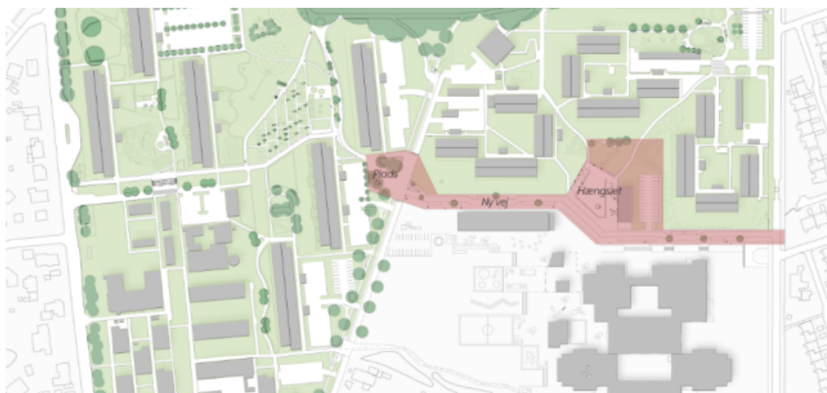
Illustration af vejgennembrud

Vejgennembruddet skaber en ny vejforbindelse mellem de offentlige veje Marslevvej og Byparken og er placeret mellem Nymarksskolen og Skovparken.