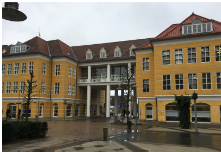
Foto af Ramsherred 10 set fra Centrumpladsen.

Ramsherred 10 – del af et samlet byggeri